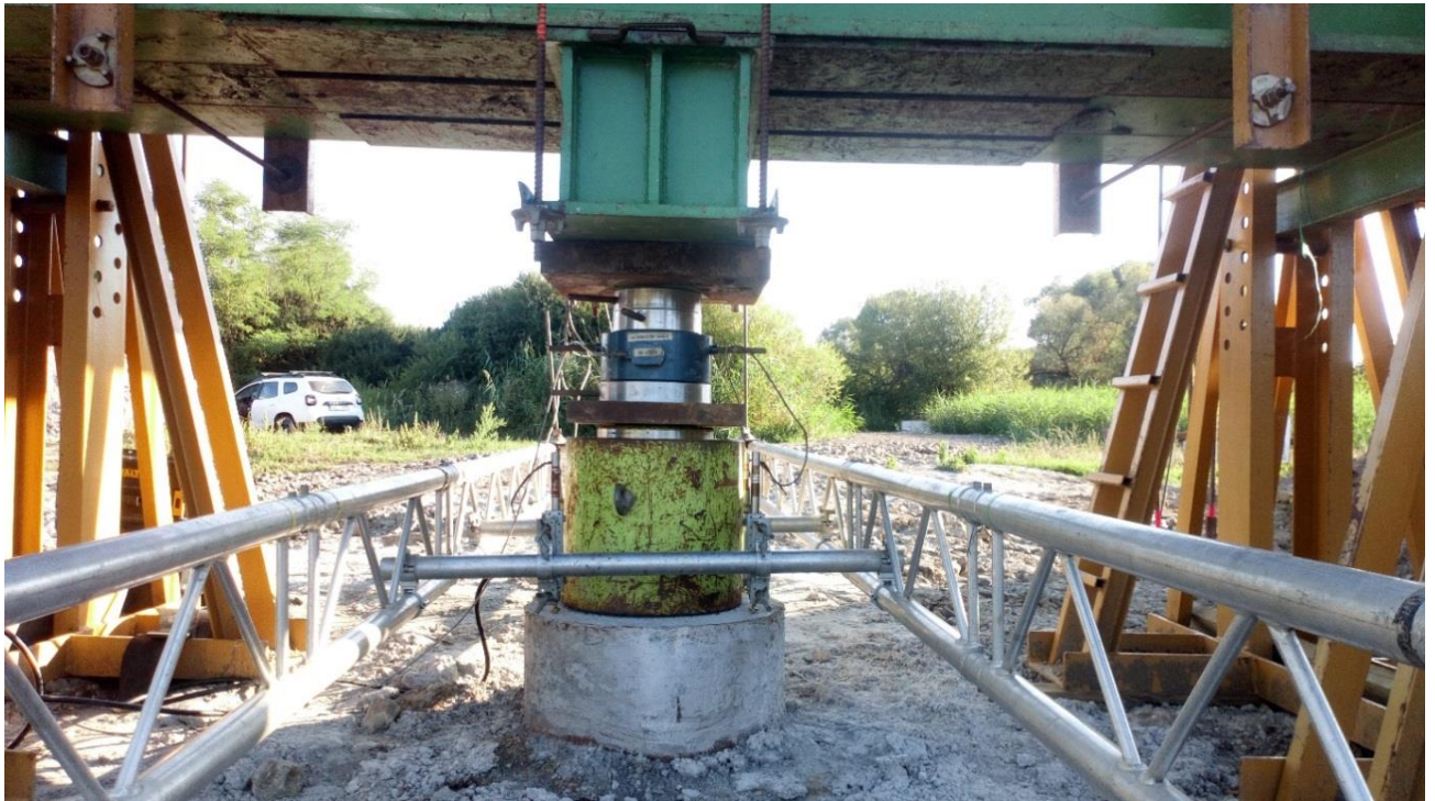
Paralelne bola odštartovaná výroba ocelevej konštrukcie mosta.